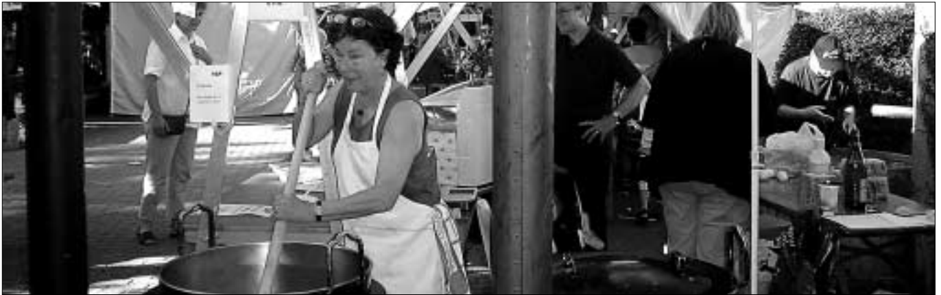
Am Quartierfest im Kreis 8.