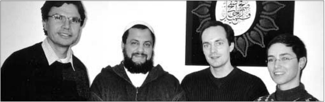
Die SP Zürich 10 auf Besuch beim Islamischen Zentrum.