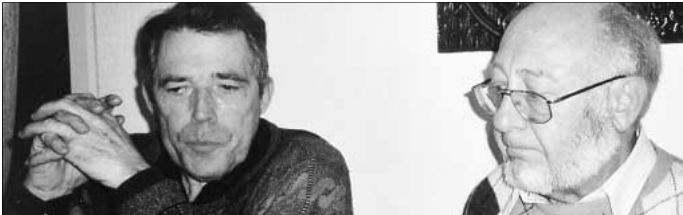
Die Zahlen: eine ernste Angelegenheit.