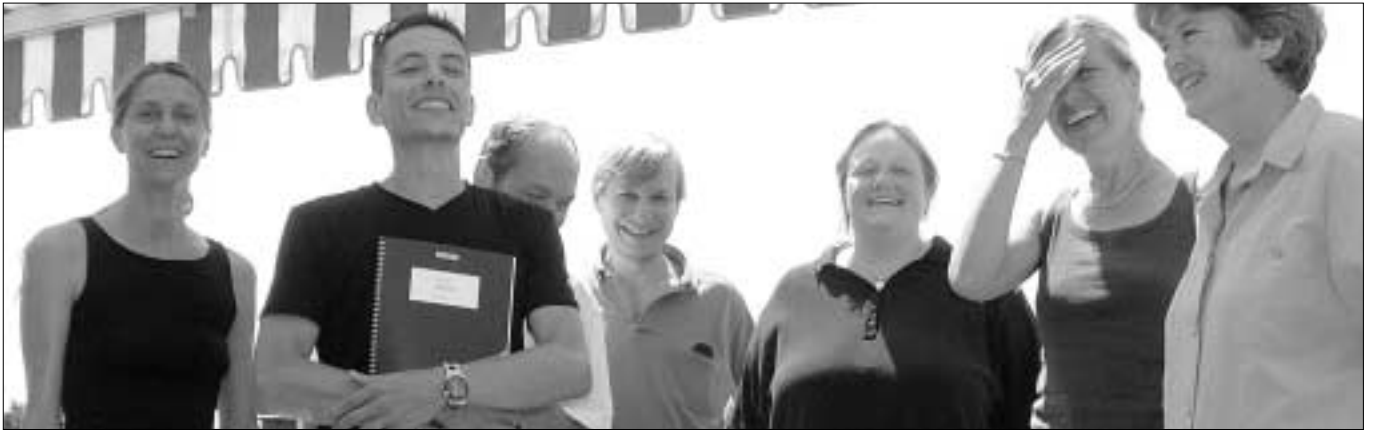
Der Vorstand der SP Zürich 8 bei der "hitzigen" Arbeit.